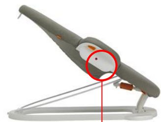
無償交換部品 (トリガー)

※お持ちの製品のシリアル番号が上記に該当していても対象外の製品の場合があります。